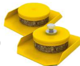
GM 15 Y GM 15B