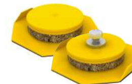
GM 20 y GM 20B