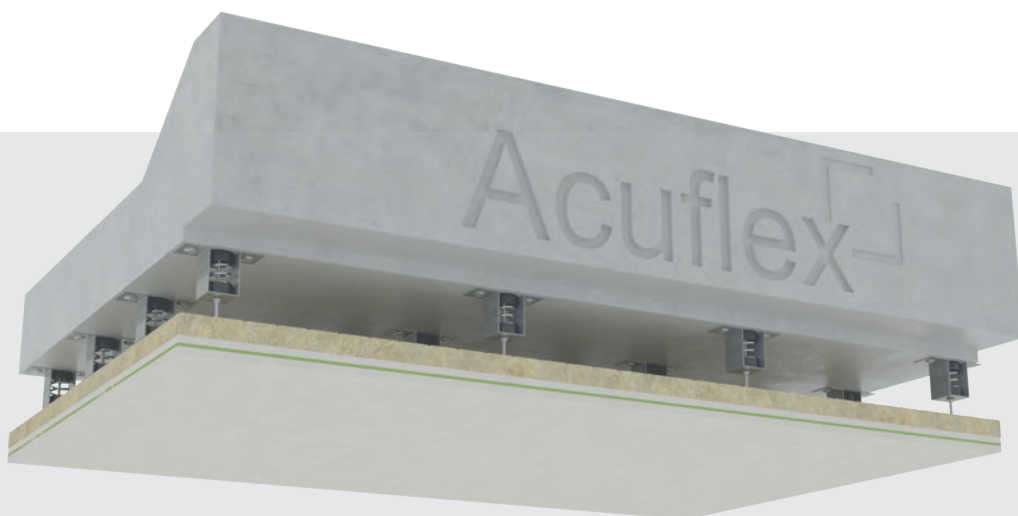
Ejemplo de montaje del antivibratorio en un techo.

Los antivibratorios de techo Acuflex Vibra Flexomer® se emplean para la atenuación de vibraciones, reduciendo el ruido transmitido por las estructuras.